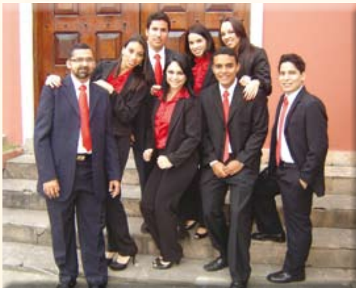
Descontração foi a tônica para os acadêmicos de Direito do X semestre da FTC