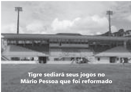
Tigre sediará seus jogos no Mário Pessoa que foi reformado

Continuando com a proposta de apoiar o esporte regional, a Cidadelle acaba de renovar o contrato com o Colo-Colo Futebol e Regatas, de Ilhéus, visando a disputa do Baianão 2015. O time de futebol ilheense foi o campeão da segunda divisão do ano passado e chegou assim à Série A, que já começa neste dia 31, sábado, quando o Tigre ilheense enfrenta a Catuense na casa do adversário. O segundo jogo será no domingo, dia 8, quando a equipe estréia no Mário Pessoa, diante da torcida, contra a Jacuipense, com a direção do clube esperando o estádio lotado.