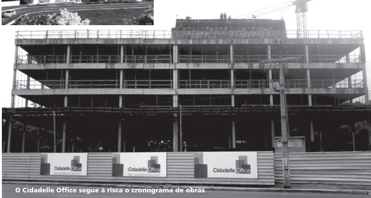
O Cidadelle Office segue à risca o cronograma de obras

Focada em entregar toda a infraestrutura da residencial House, incluindo o clube, guarita e outros equipamentos, no km 24 da Rodovia Jorge Amado (Ilhéus/Itabuna), com data definida para 24 de abril próximo, a Cidadelle Empreendimentos ultima os últimos detalhes da obra, enquanto segue paralelamente o cronograma de outras duas iniciativas que realiza no sul da Bahia, o Cidadelle Office, na mesma região e o Cidadelle Praia do Sul, um residencial à beira-mar no km 5 da rodovia Ilhéus/Olivença.