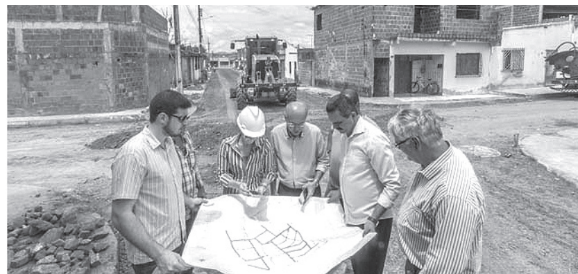
Prefeito Claudovane Leite visitou obras no Sinval Palmeira ouve moradores e técnicos

O prefeito de Itabuna, Claudovane Leite, acompanhou de perto na sexta-feira, 9/10, o andamento das obras do PAC-II que vão beneficiar milhares de famílias que há mais de 40 anos esperavam por investimento na infraestrutura do bairro Sinval Palmeira. Os operários da empresa contratada pela Prefeitura para a execução dos serviços estão concluindo o nivelamento das ruas, recuperando meio-fio e redes de água e esgoto para aplicação da massa asfáltica a partir da próxima semana.