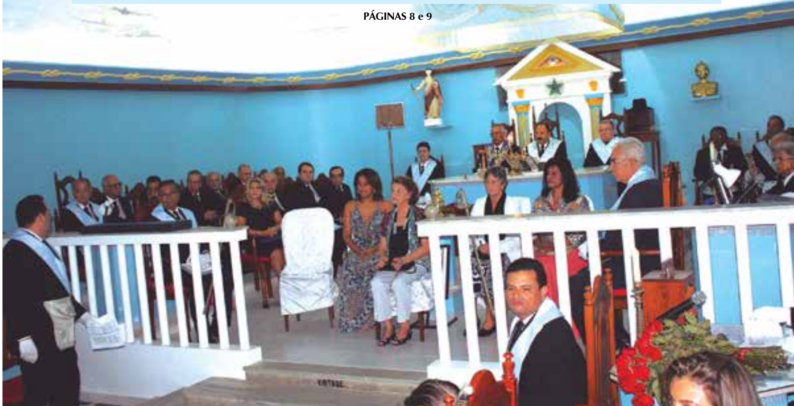
PÁGINAS 8 e 9

A Loja Maçônica Areópago Itabunense, jurisdicionada a Grande Loja Maçônica do Estado da Bahia (GLEB), do oriente de Itabuna, no último dia 15/05, homenageou as mulheres-mães pela passagem do Dia das Mães. A solenidade que aconteceu nas dependências da Loja no centro da cidade, homenageou a mãe mais idosa, a mais jovem e as viúvas, bem como premiou com lembranças todas as mães presente com rosas vermelhas e brancas. E no final do evento foi servido um jantar com música ao vivo e de qualidade.