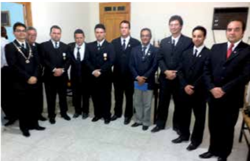
Maçons de diversas Lojas da Região Sul da Bahia, que estiveram presentes no evento.

Todos esses eventos fizeram parte da programação do aniversário de 25 anos de fundação e instalação do Capítulo Buerarema da Ordem Demolay, nº 64, SCODRFB/GCE-BA.