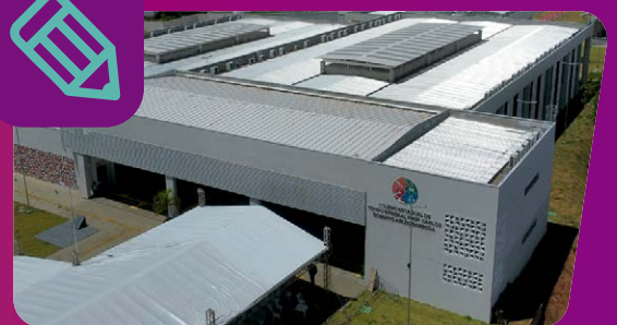
11 ESCOLAS DE TEMPO INTEGRAL NA REGIÃO. 4 EM ILHÉUS