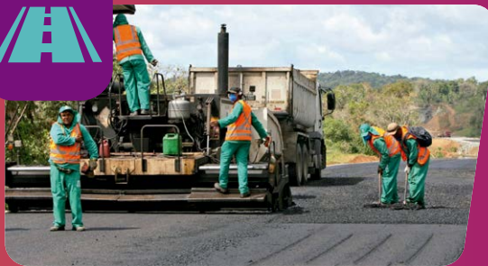
DEM AÍ: DUPLICAÇÃO DA BA-963 EM ITABUNA