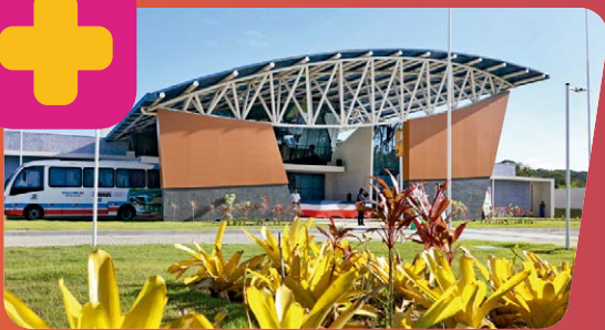
POLICLÍNICA REGIONAL EM ILHÉUS