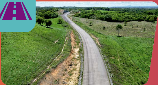
TÁ CHEGANDO: SISTEMA VIÁRIO DA BA-649