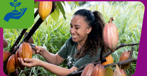
APOIO AO PROJETO PARCEIROS DA MATA

A Bahia virou líder nacional em investimentos trabalhando para melhorar a vida das pessoas, inclusive em Itabuna e região. Hoje temos uma das maiores redes de hospitais e policlínicas estaduais do Brasil, as escolas de Tempo Integral mais modernas do país, estrada boa para o desenvolvimento avançar, apoio ao desenvolvimento sustentável. E, com a parceria Bahia-Brasil, vai ter muito mais.