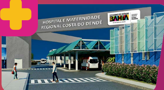
DEM AÍ: HOSPITAL E MATERNIDADE COSTA DO DENDÊ EM VALENÇA